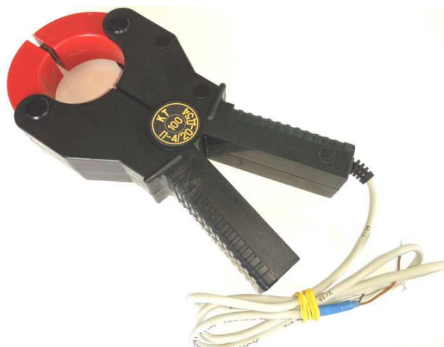
Рисунок 6 – Общий вид клещей токоизмерительных КТ-***-П-4/20-Д54