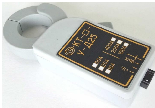
Рисунок 1 – Общий вид клещей токоизмерительных КТ-***-У-Д25

Пломбирование клещей токоизмерительных КТ не предусмотрено.