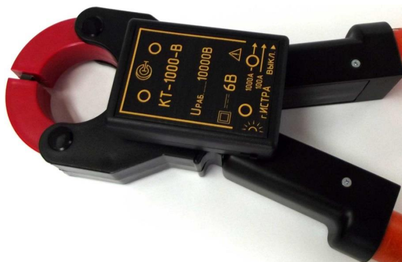
Рисунок 8 – Общий вид клещей токоизмерительных КТ-1000-В (без ручек)