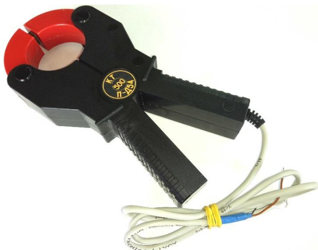
Рисунок 5 – Общий вид клещей токоизмерительных КТ-***-П-Д54