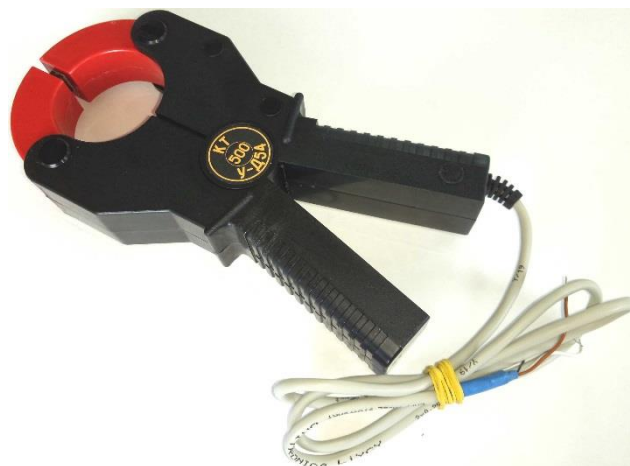
Рисунок 2 – Общий вид клещей токоизмерительных КТ-***-У-Д54