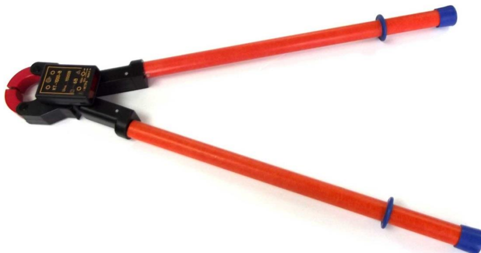
Рисунок 7 – Общий вид клещей токоизмерительных КТ-1000-В (с ручками)