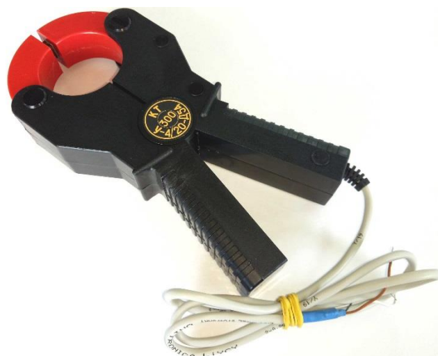
Рисунок 4 – Общий вид клещей токоизмерительных КТ-***-У-4/20-Д54