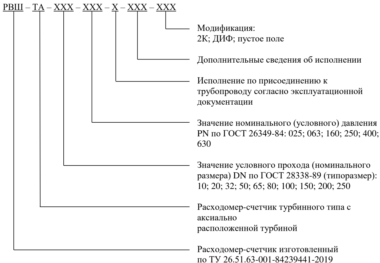
Схема условного обозначения расходомеров:

Общий вид расходомера представлен на рисунках 1 и 2.