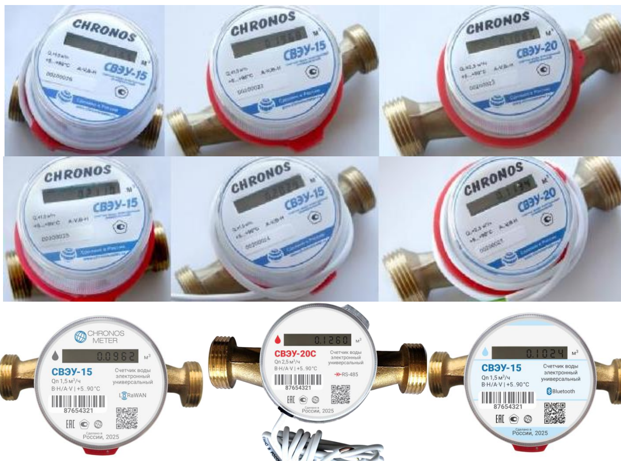
Р и с у н о к 3 – Общий вид счетчиков типоразмера 3