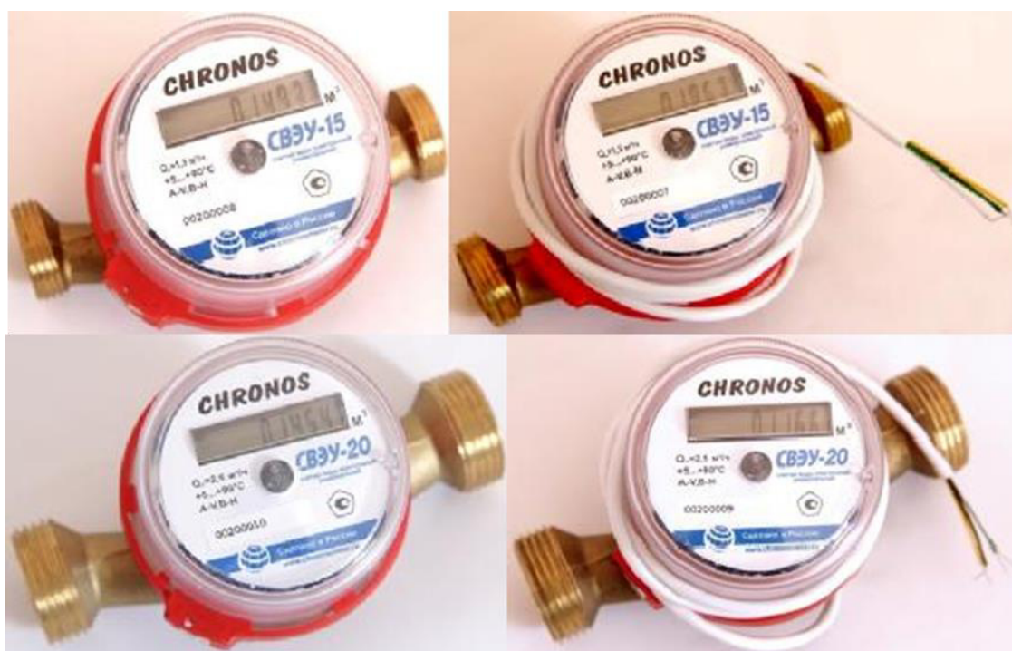
Р и с у н о к 2 – Общий вид счетчиков типоразмера 2