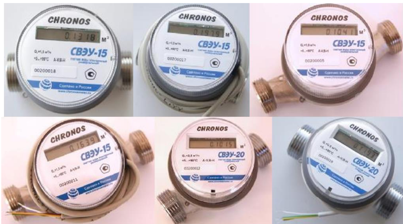
Р и с у н о к 1 – Общий вид счетчиков типоразмера 1