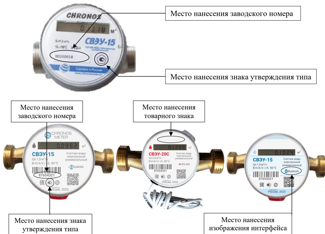
Р и с у н о к 5 – Места нанесения заводского номера и знака утверждения типа, а также, место нанесения товарного знака и место нанесения изображения интерфейса связи