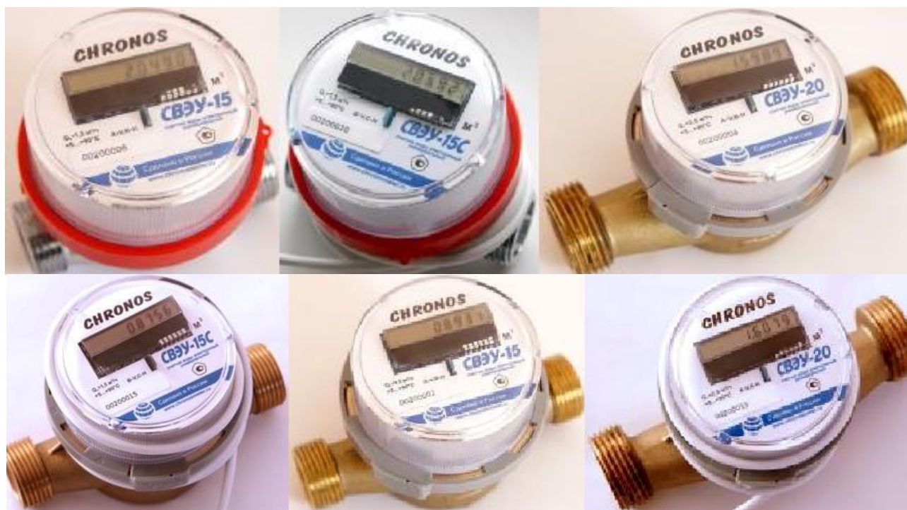
Р и с у н о к 4 – Общий вид счетчиков типоразмера 4