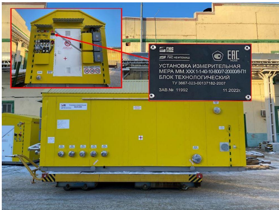
Рисунок 1 – Установка измерительная «Мера-ММ.ХХХ». Общий вид. Место нанесения заводских номеров

Примечание – Установки измерительные «МЕРА-ММ.ХХХ», выпущенные ранее и не имеющие обозначения модификации, относятся к модификации установок, работающих по сепарационному принципу действия.