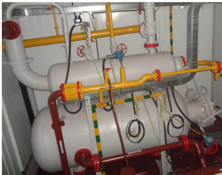
Рисунок 2 – Установка измерительная «МЕРА-ММ.ХХХ». Общий вид. Блок технологический сепарационный