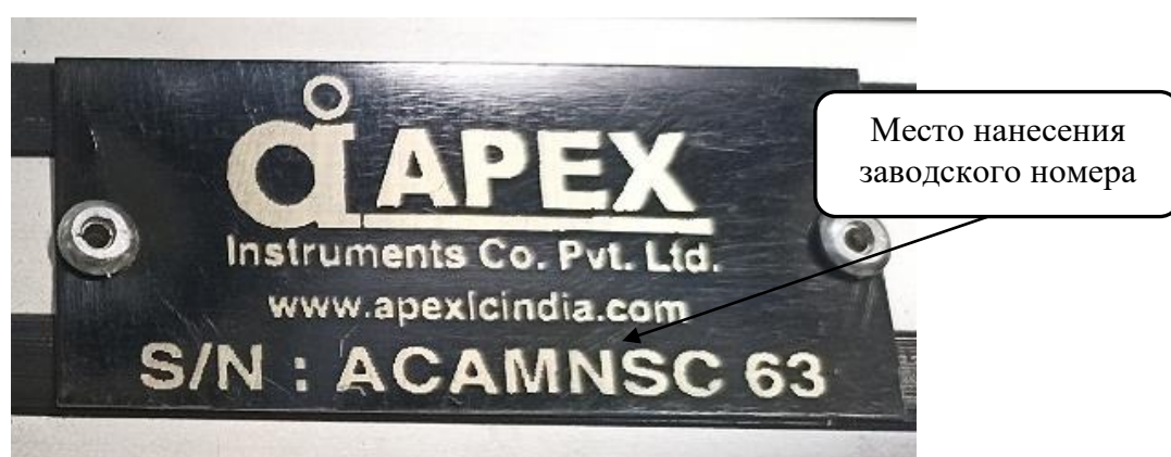
Рисунок 2 – Место нанесения заводского номера на анализаторы контактного угла оптические АСАМ

Пломбирование анализаторов не предусмотрено.