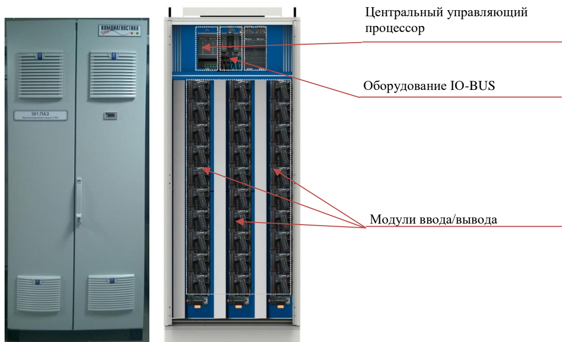
Рисунок 2 – Общий вид станций управления полем СУТПА «КОМСИС»