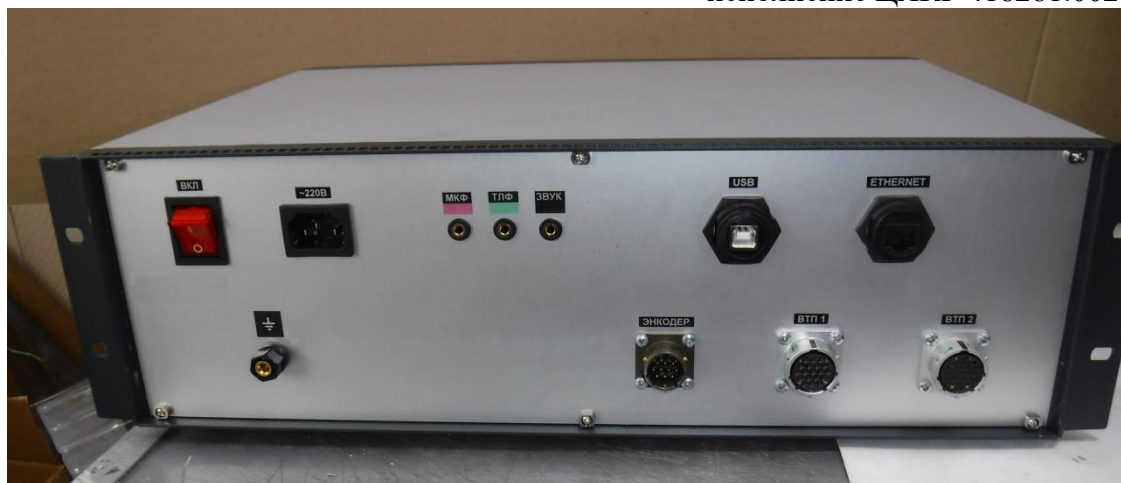
исполнение ЦЯКГ 418281.002.02