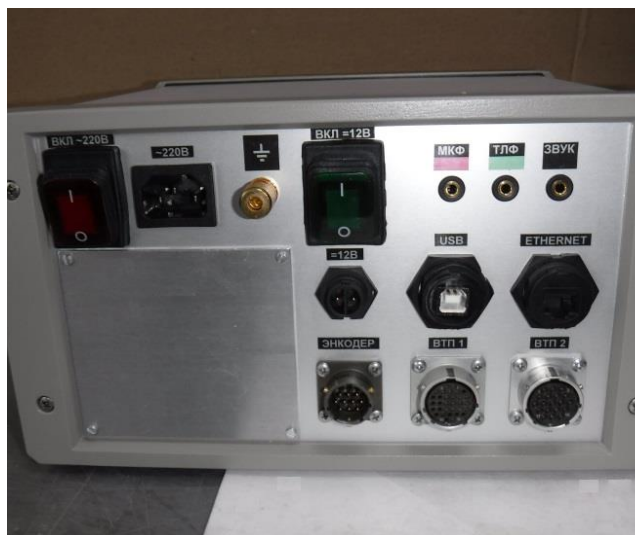
исполнение ЦЯКГ 418281.002.01