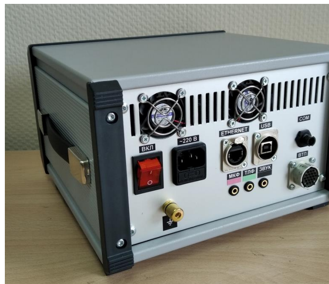
исполнение ЦЯКГ 418281.002.03