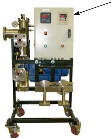
Рисунок 2 – Общий вид установки модификации «Р»