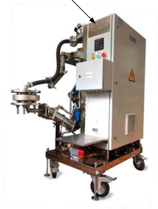
Рисунок 1 – Общий вид установки модификации «А»