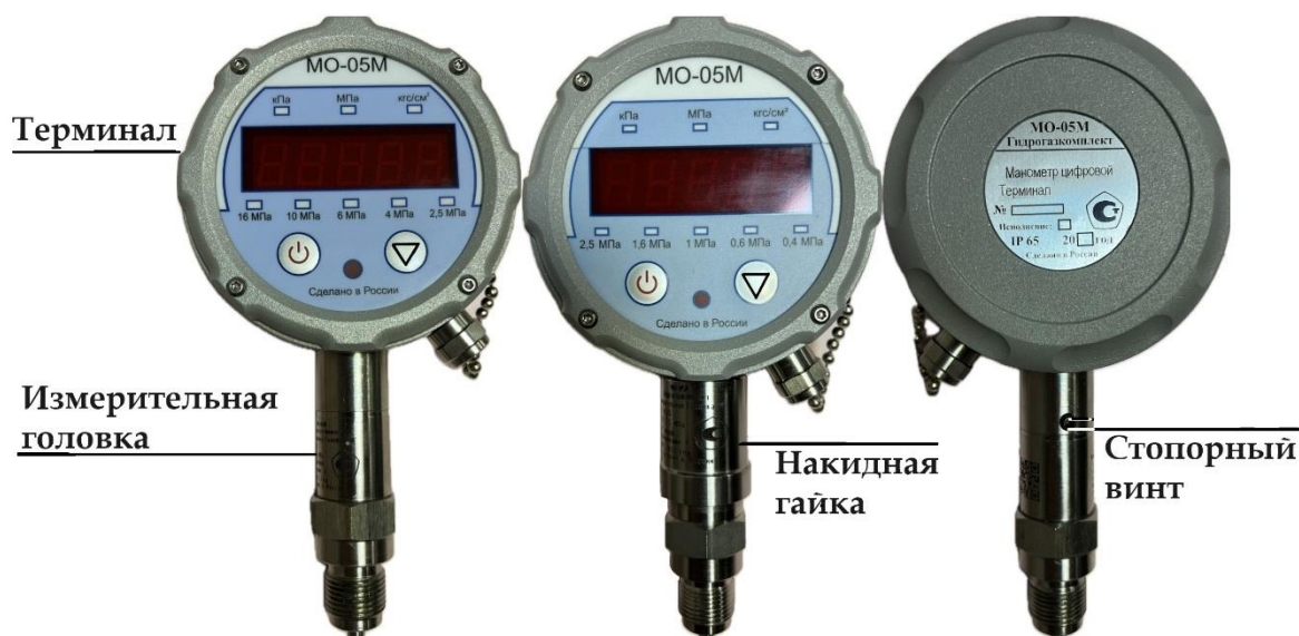
Рисунок 1 – Общий вид манометров исполнения 1

Места нанесения знака утверждения типа и заводского номера приведены на рисунках с 7 по 9.