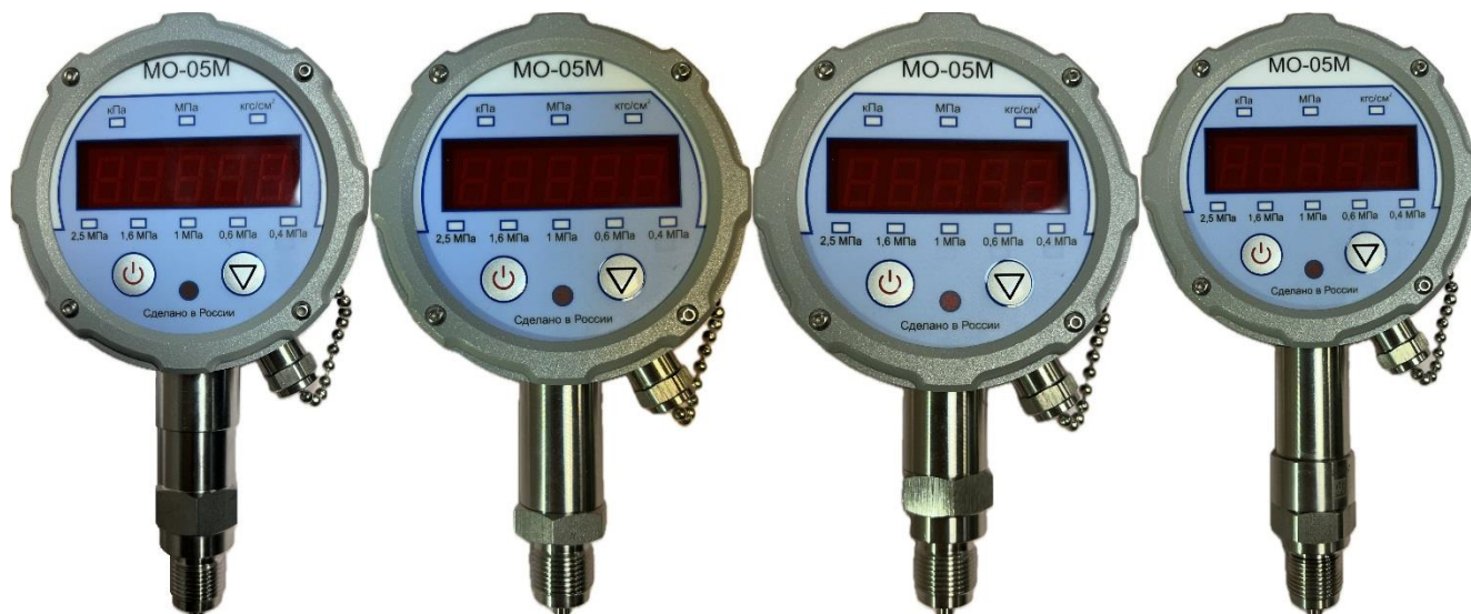
Рисунок 3 – Общий вид манометров исполнения 3