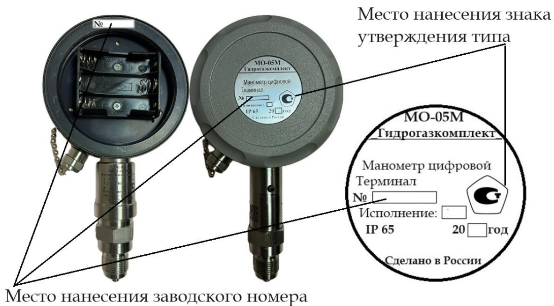
Рисунок 7 – Место нанесения знака утверждения типа и заводского номера для исполнений 1, 5, 5МС, 8, 8МС