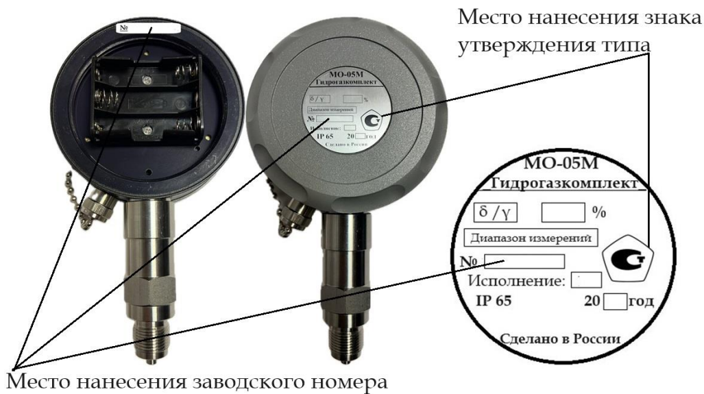
Рисунок 8 – Место нанесения знака утверждения типа и заводского номера для исполнений 2, 3, 4, 4МС, 6, 6МС, 7, 7МС