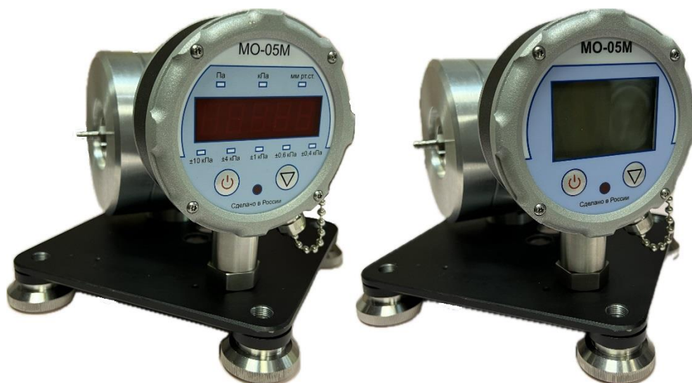
Рисунок 2 – Общий вид манометров исполнений 2, 4, 4МС