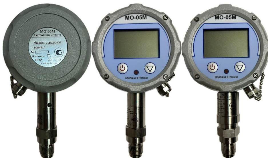
Рисунок 4 – Общий вид манометров исполнений 5, 5МС, 8, 8МС