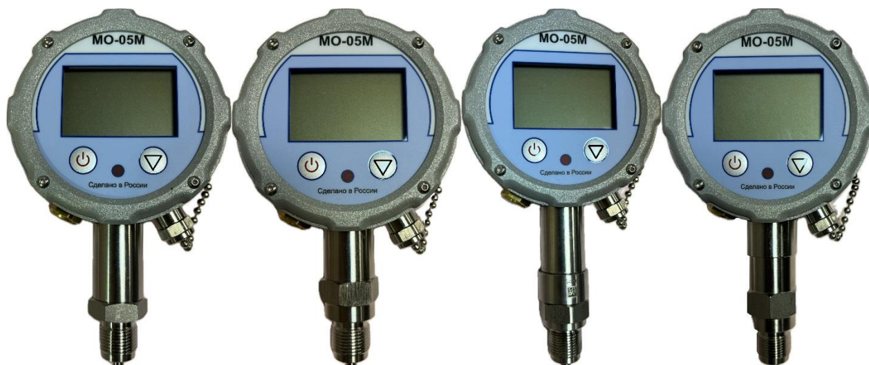
Рисунок 6 – Общий вид манометров исполнений 6МС, 7МС