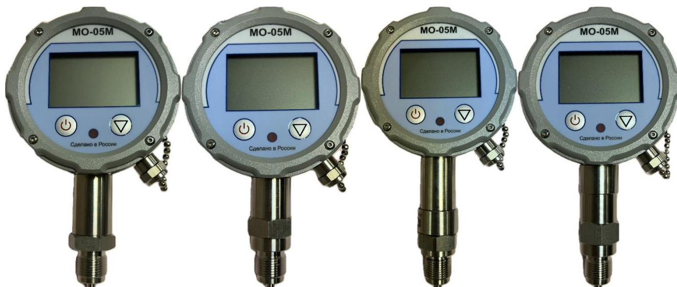
Рисунок 5 – Общий вид манометров исполнений 6, 7