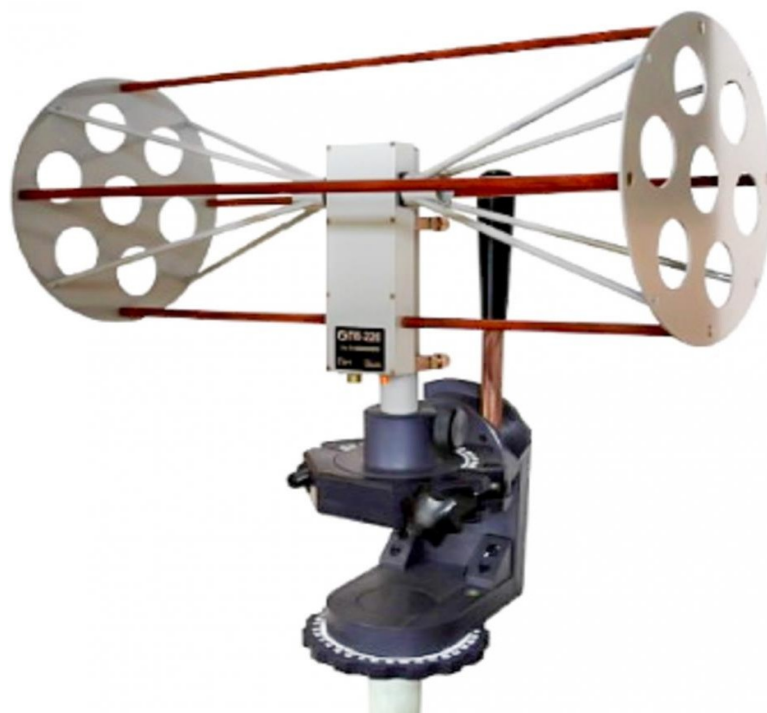
Рисунок 1 - Внешний вид антенны П6-220