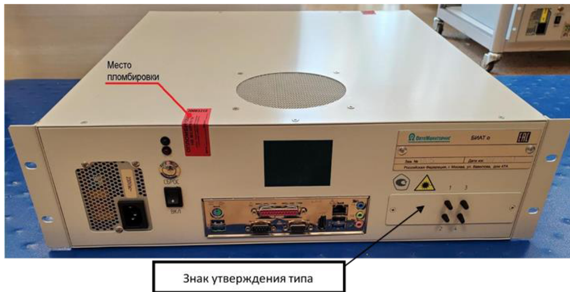
Рисунок 1 – Общий вид блока опроса БИАТ о (лицевая сторона)

Измерители имеют заводские номера, обеспечивающие идентификацию каждого экземпляра, номер наносится на маркировочную табличку ударным способом в виде цифрового обозначения (рисунок 4).