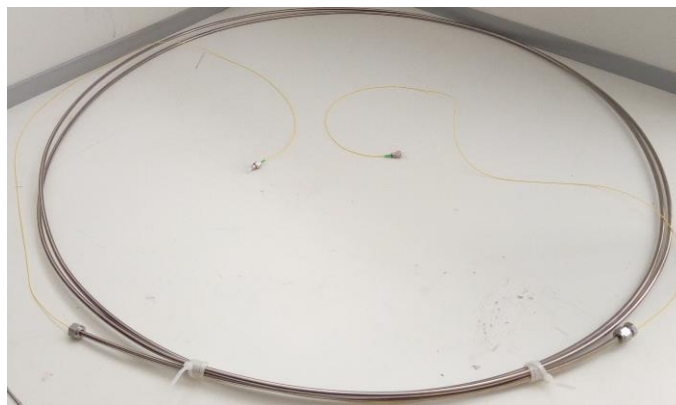
Рисунок 3 – Общий вид волоконно-оптического кабеля системы