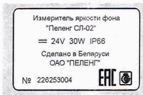
Рисунок 1.3 – Фотография маркировки измерителей яркости фона «Пеленг СЛ-02» (изображение носит иллюстративный характер)