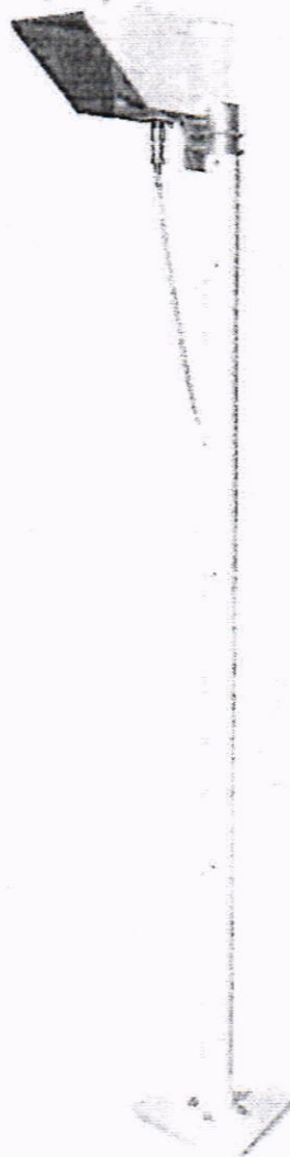
Рисунок 1.1 – Фотография общего вида измерителей яркости фона «Пеленг СЛ-02» (изображение носит иллюстративный характер)