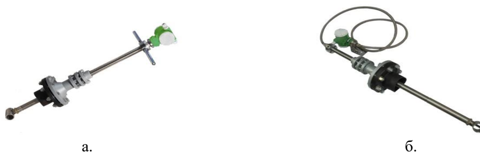
Рисунок 3 – Общий вид расходомеров-счетчиков вихревых «ЭМИС-ВИХРЬ 200» модификации ЭВ-205 (а. интегральное исполнение; б. дистанционное исполнение)