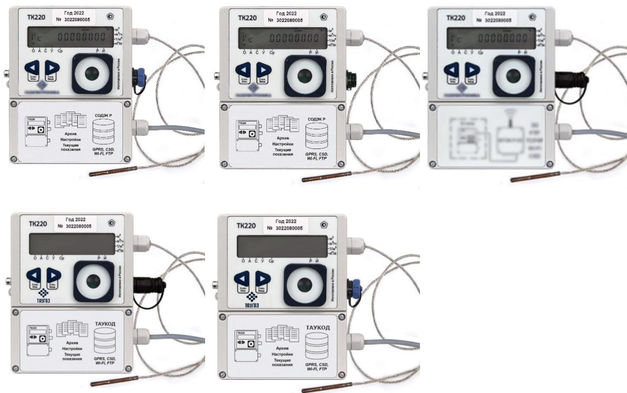
Рисунок 1 – Общий вид основных исполнений корректора