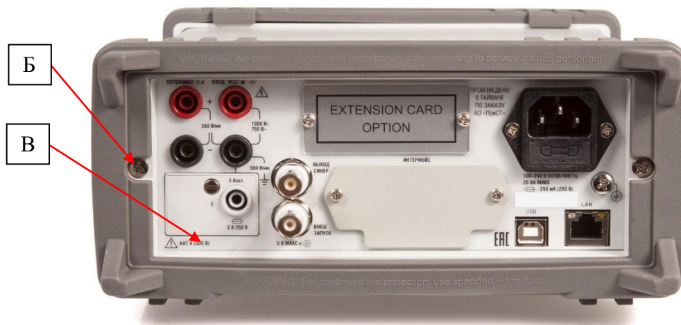
Рисунок 2 – Схема пломбировки от несанкционированного доступа (Б) и место нанесения заводского номера (В)