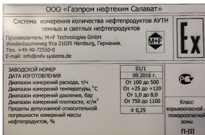
Рисунок 1 – Информационная табличка Системы, содержащая заводской номер, дату изготовления, наименование изготовителя, диапазон измерений, класс взрывозащиты и знак утверждения типа средства измерения

Заводской номер Системы, обеспечивающий идентификацию Системы как средства измерений, размещен в операторной. Способ и формат нанесения заводского номера обеспечивает возможность прочтения, полной информативности и сохранности в процессе эксплуатации, знак утверждения типа нанесен. Информационная табличка Системы приведена на рисунке 1.