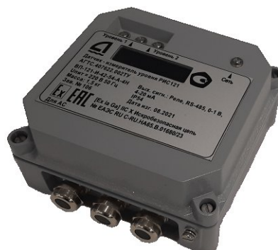
Рисунок 1 – Общий вид вторичного преобразователя, место нанесения знака утверждения типа и заводского номера

Внешний вид ВП, место нанесения знака утверждения типа и заводского номера представлены на рисунке 1. Внешний вид ПП различного исполнения представлен на рисунке 2.