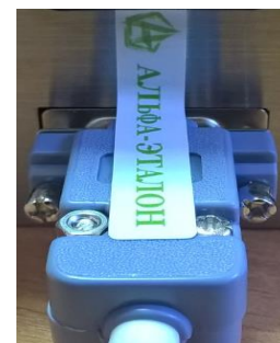
Рисунок 4 – Схема пломбировки от несанкционированного доступа, обозначение мест нанесения знака поверки