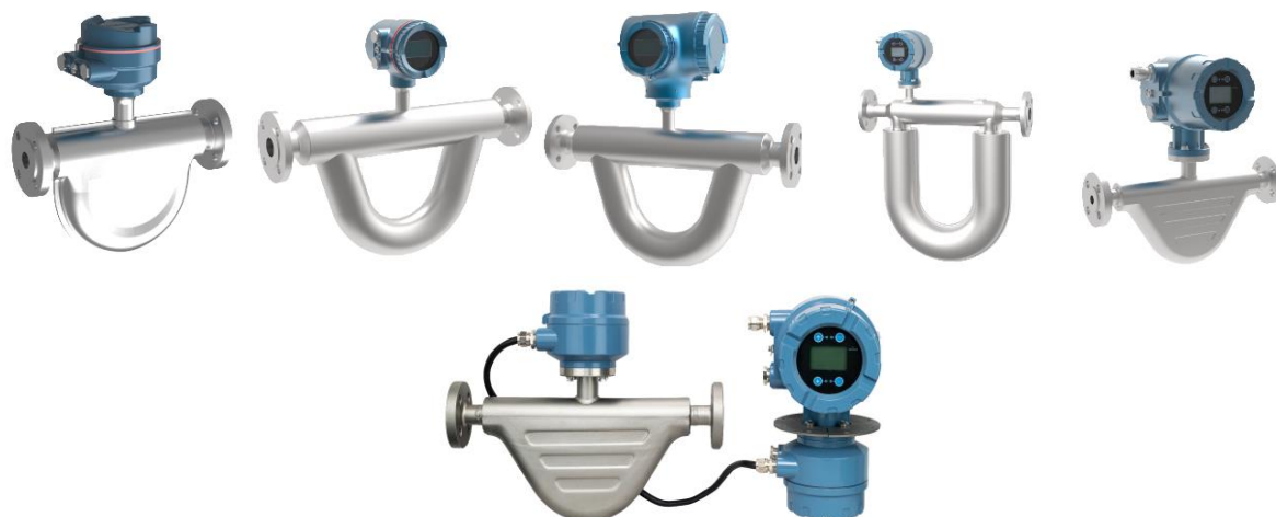
Рисунок 3 – Общий вид расходомеров