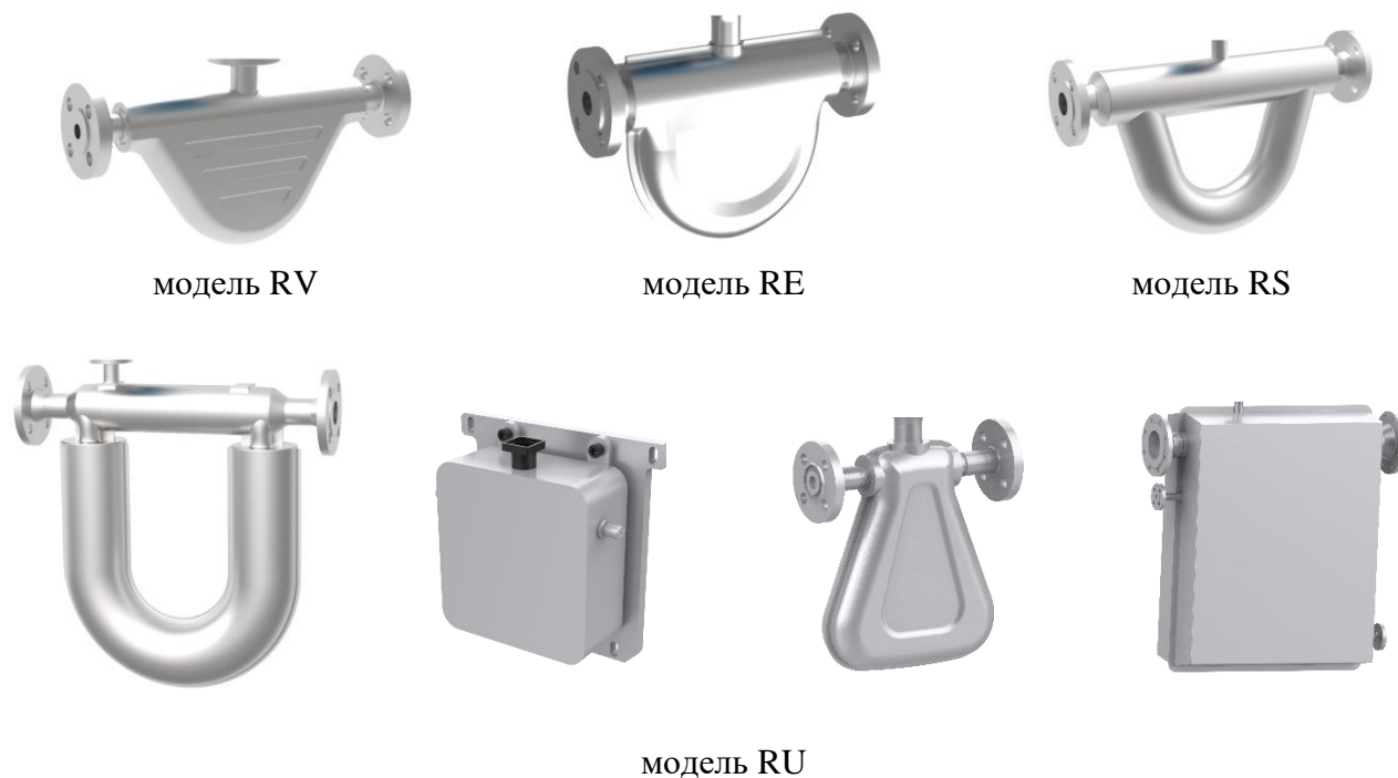
Рисунок 1 – Общий вид ПП расходомеров

Заводской номер расходомеров, состоящий из арабских цифр, наносится методом, принятым на заводе-изготовителе, на маркировочные таблички, расположенные на ПП и ЭП. Нанесение знака поверки на расходомеры не предусмотрено. Пломбирование расходомеров не предусмотрено.