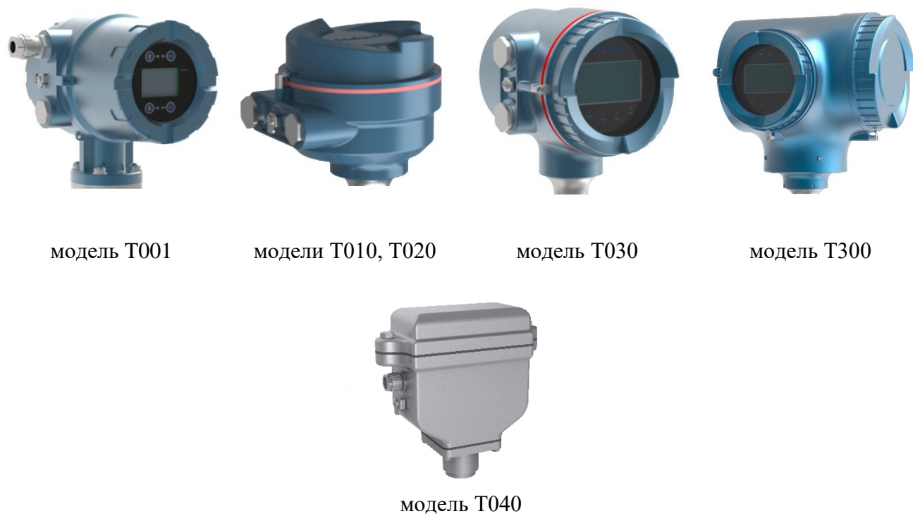
Рисунок 2 – Общий вид ЭП расходомеров