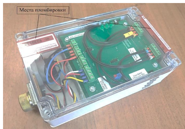
Рисунок 4 – Места пломбирования от несанкционированного доступа