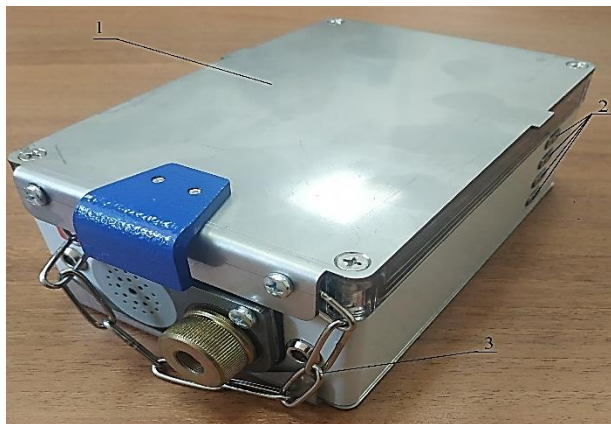
Рисунок 1 – Общий вид метанометров в сборе

Предусмотрено пломбирование от несанкционированного доступа: пломбировочные наклейки (рисунок 4) устанавливаются на торцах пластикового корпуса.