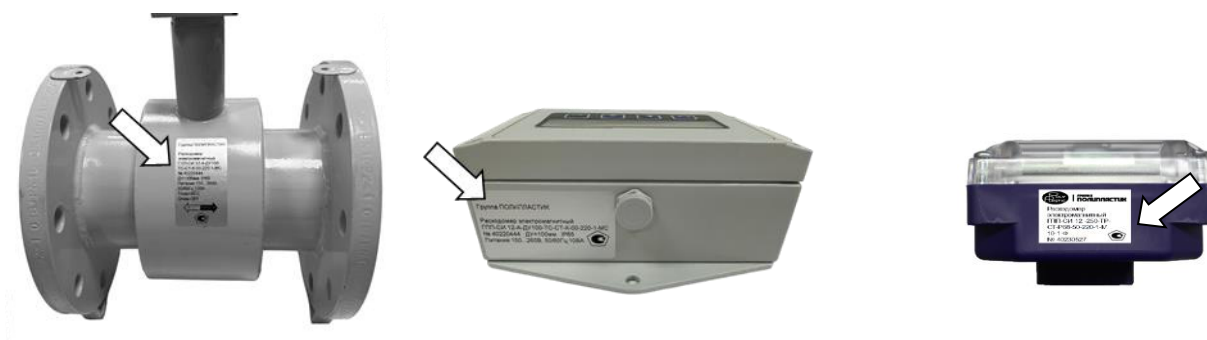
Рисунок 3 – Указание места нанесения заводского номера и знака утверждения типа