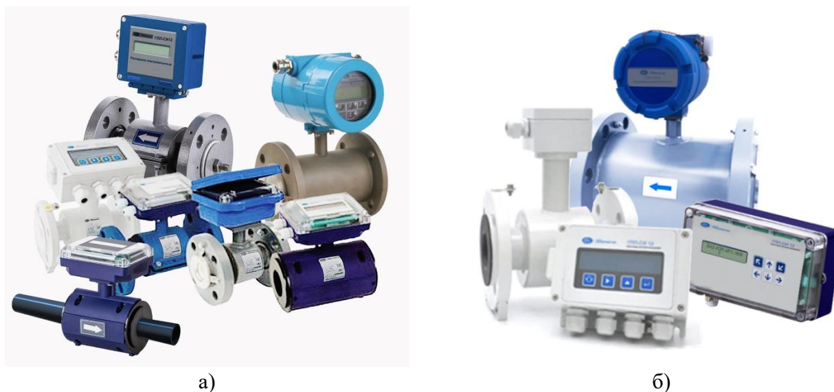
Рисунок 1 – Внешний вид расходомеров электромагнитных ГПП-СИ 12: а) компактное исполнение, б) раздельное исполнение

Заводские номера расходомеров имеют цифровой формат, наносятся на корпус клеммой коробки первичного преобразователя и на корпус конвертера при помощи наклейки. Указание места нанесения заводского номера и знака утверждения типа изображено на рисунке 3.