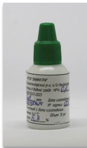
Рисунок 1 – Общий вид мер размеров частиц в водной среде МРЧ-0,2