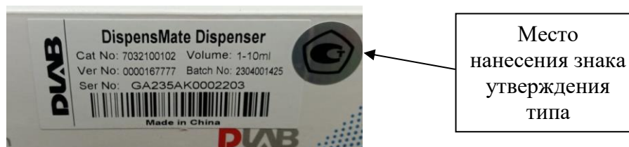
Рисунок 3 – Место нанесения знака утверждения типа