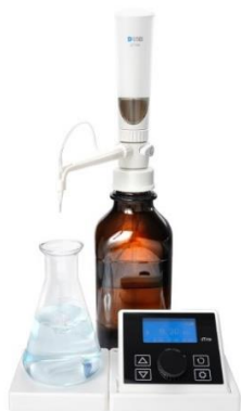
а) диспенсер dTrite с максимальным подъемом поршня 10 мл

Пломбирование и нанесение знака поверки на средство измерений не предусмотрены.