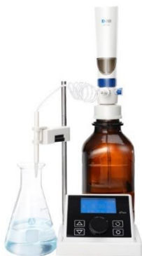
в) диспенсер dFlow