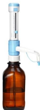
г) диспенсер DispensMate