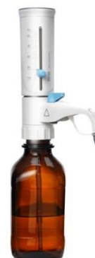
д) диспенсер DispensMate Pro