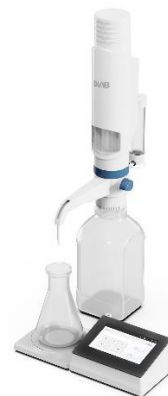
б) диспенсер dTrite с максимальным подъемом поршня 25 и 50 мл