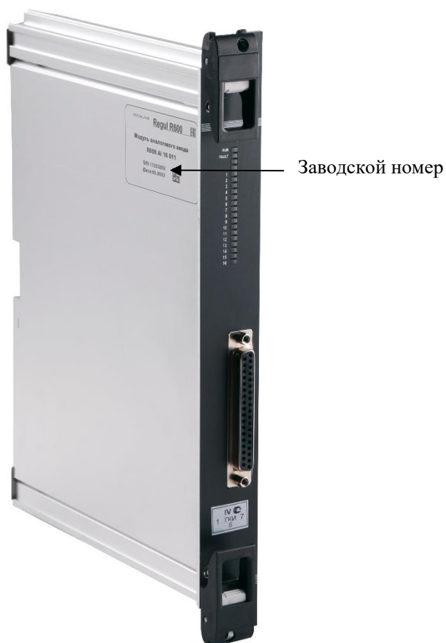
Рисунок 1 – Общий вид модулей контроллера REGUL R600