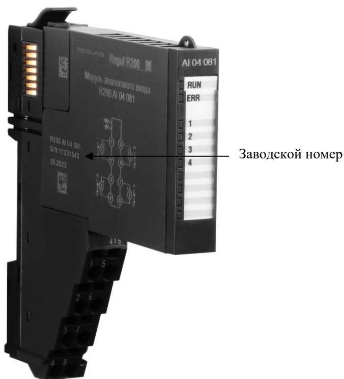
Рисунок 4 – Общий вид модулей контроллера REGUL R200