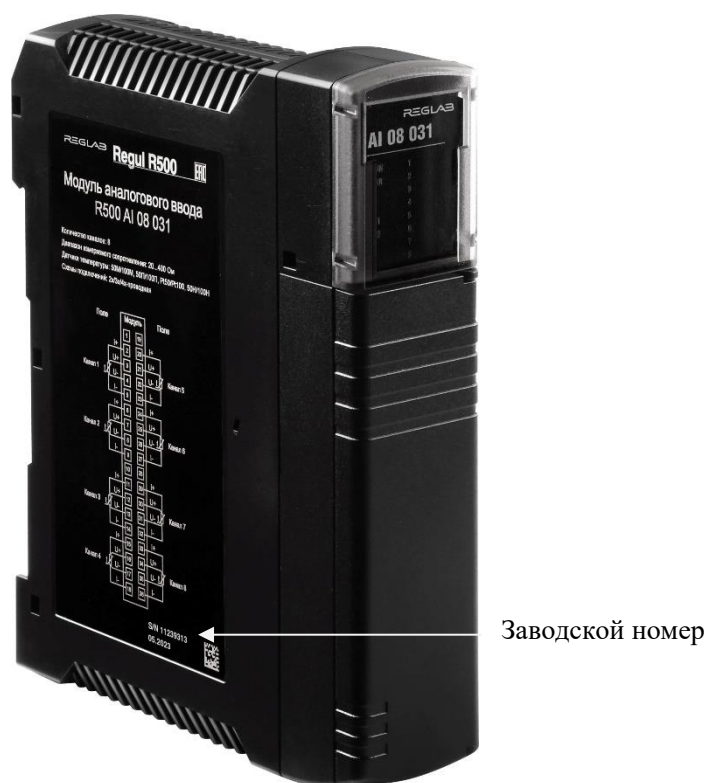
Рисунок 2 – Общий вид модулей контроллера REGUL R500