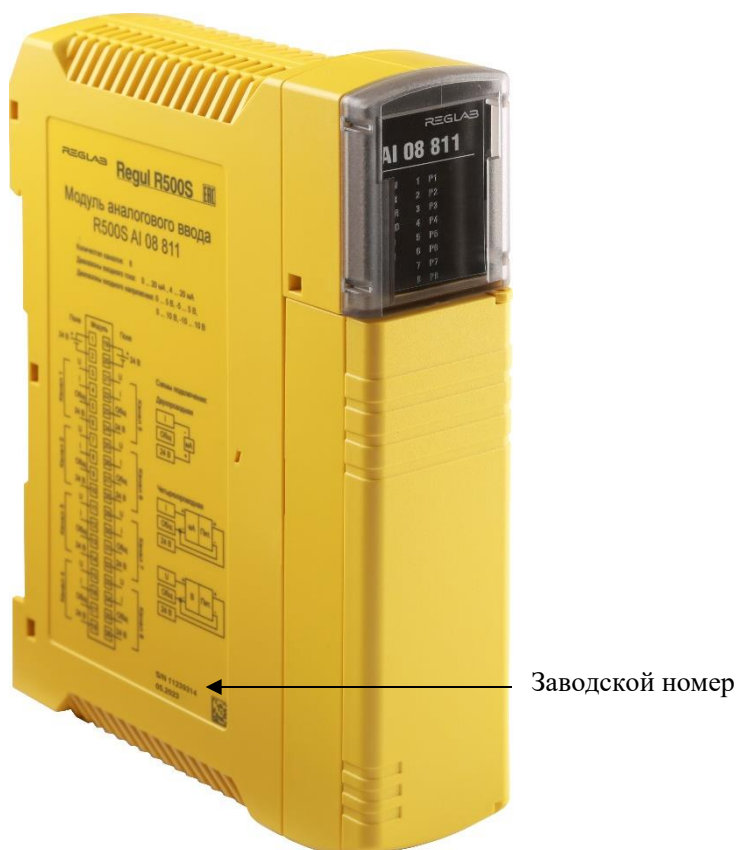
Рисунок 3 – Общий вид модулей контроллера REGUL R500S