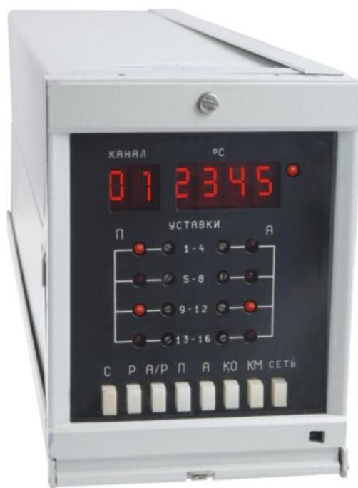
Рисунок 1 – Фотография общего вида