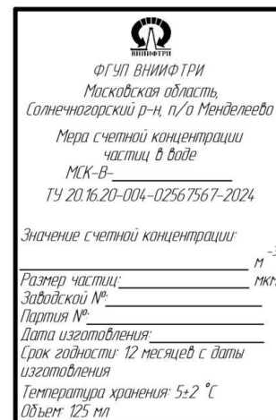
Рисунок 2 – Этикетка с идентификационными данными мер

Нанесение знака утверждения типа и знака поверки непосредственно на меры не предусмотрено.