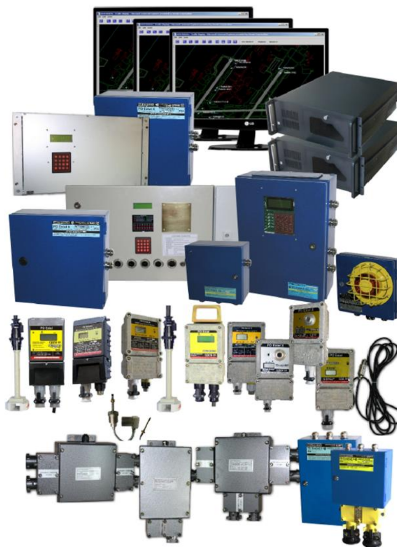
Рисунок 1 – Общий вид основных компонентов Микон III

Заводской номер Микон III в виде цифрового обозначения наносится на шильд методом гравировки в соответствии с рисунком 2 и указывается в формуляре. Шильд размещается на корпусе серверного шкафа из состава Микон III.