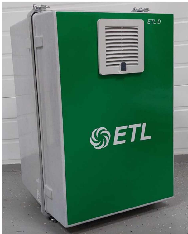
а) внешний вид корпуса

осуществляется с помощью таблички, расположенной на корпусе. Серийный номер в буквенно-цифровом формате наносится на табличку с помощью графических устройств.