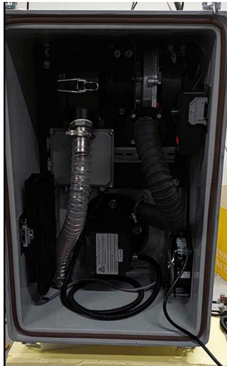
б) расположение компонентов внутри корпуса