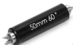
Рисунок 4 – Общий вид установочных мер для микрометров модификаций МВМ, МВМЦ