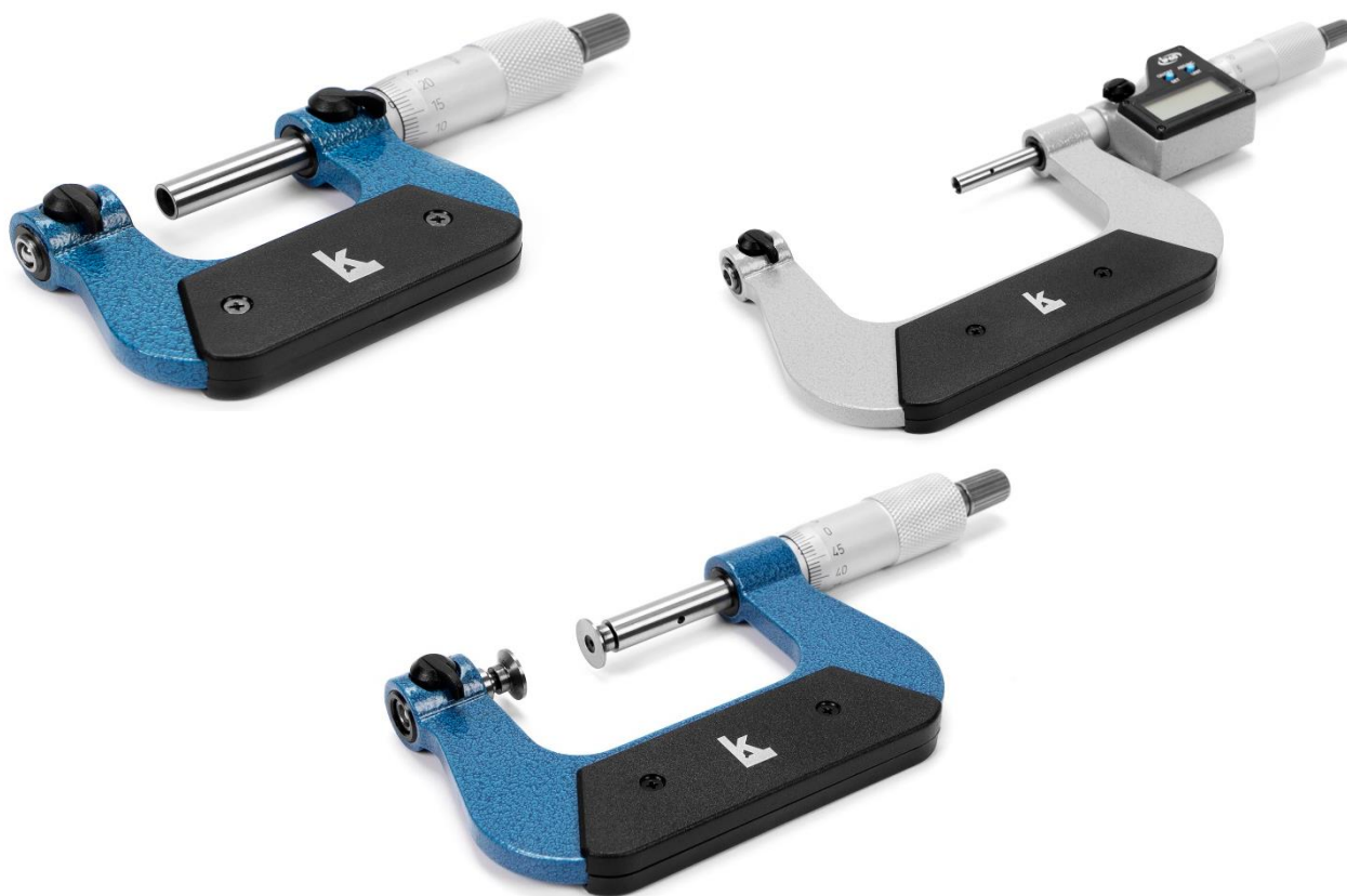
Рисунок 1 – Общий вид микрометров

Заводской номер в виде цифрового или буквенно-цифрового обозначения наносится на теплоизоляционную накладку или барабан микрометрической головки краской или методом лазерной маркировки. Общий вид и место нанесения заводского номера на микрометры представлены на рисунке 6.