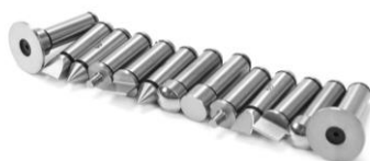
Рисунок 3 – Общий вид сменных вставок для микрометров модификаций МВУ и МВУЦ