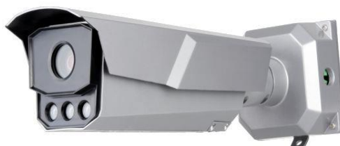
Рисунок 2 – ТВ датчик тип 1 (детализирующий)