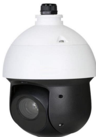
Рисунок 3 –ТВ датчик тип 2 (поворотный)

Корпуса вычислительного модуля и ТВ датчиков могут изготавливаться следующих цветов: белый, серый, серебристый, черный, коричневый и их оттенков.