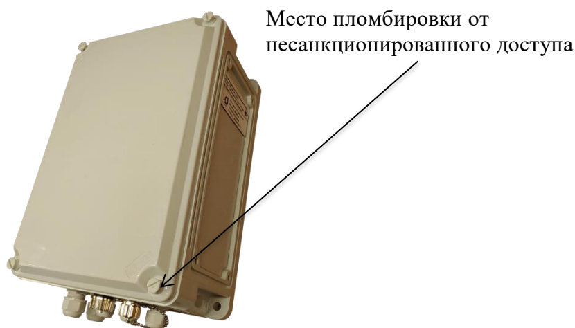
Рисунок 1 – Общий вид вычислительного модуля

Общий вид комплексов, место пломбировки от несанкционированного доступа представлены на рисунках 1- 3.