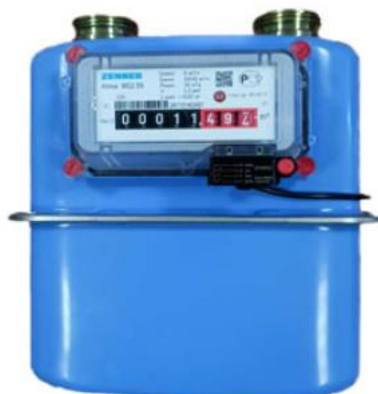
исполнение Atmos WG2.5 (WG6)