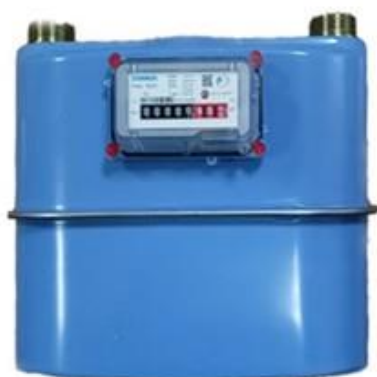
исполнение Atmos G1.6 (G2.5; G4; G6)

Общий вид счетчиков и места установки пломб для защиты от несанкционированного доступа представлены на рисунке 1.