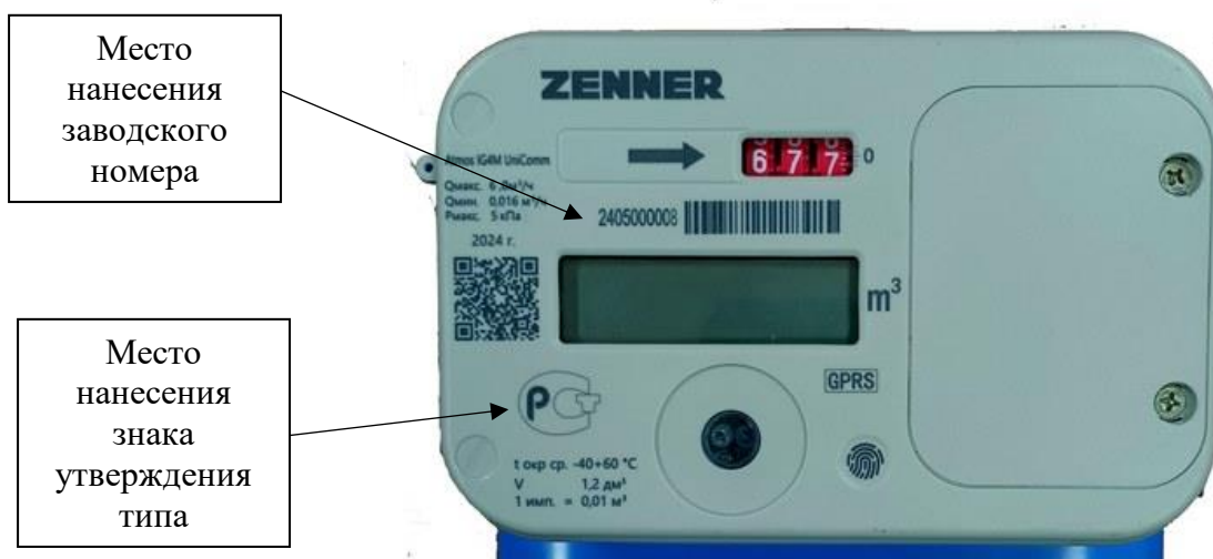
Рисунок 2 – Места расположения заводского номера и нанесения на корпус счетчика знака утверждения типа средств измерений