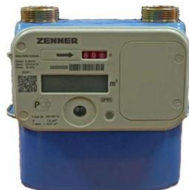
исполнение Atmos Unicom IG1.6 (Unicom IG2.5; Unicom IG4; Unicom IG6)