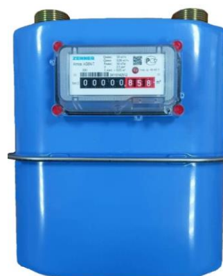
исполнение Atmos AG1.6 (AG2.5; AG4; AG6)