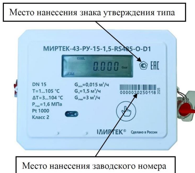
Рисунок 1 – Общий вид средства измерений

Общий вид теплосчетчиков приведен на рисунках 1 – 2.