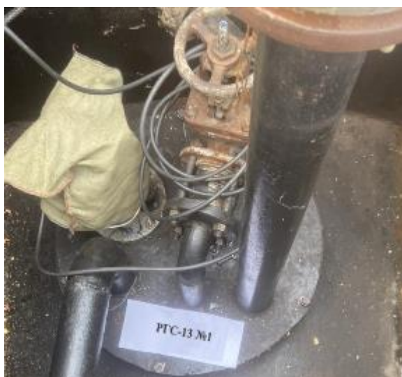
Рисунок 3 – Горловина резервуара РГС-13 зав.№ 1