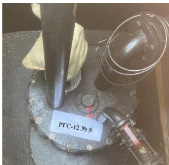
Рисунок 2 – Горловина резервуара РГС-12 зав.№ 5