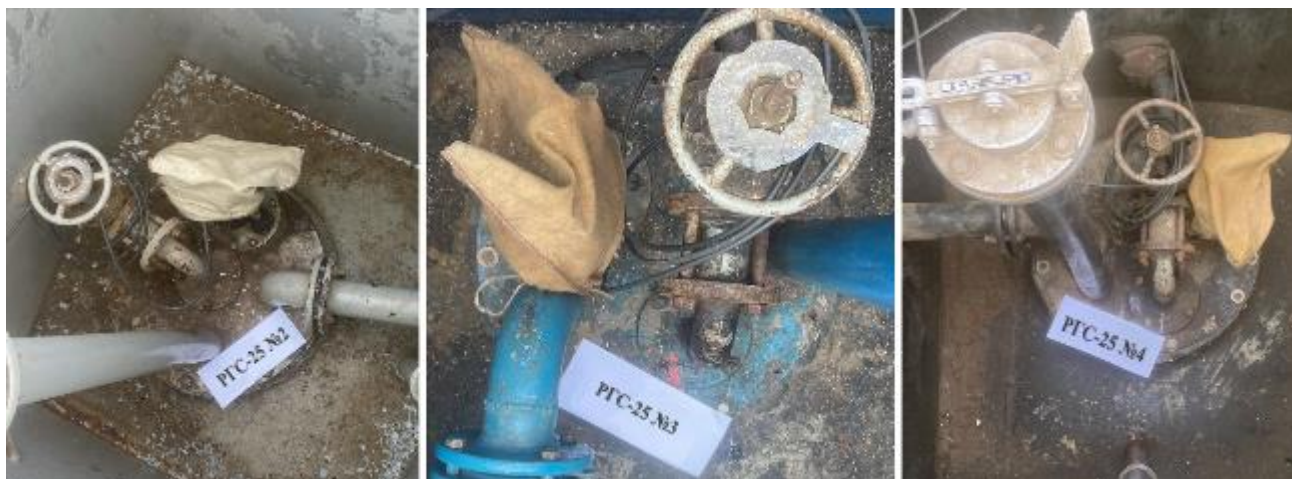
Рисунок 4 – Горловины резервуаров РГС-25 зав.№№ 2, 3, 4

Пломбирование резервуаров РГС не предусмотрено.