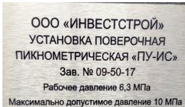
Рисунок 1 – Место нанесения заводского номера

Пломбирование установок не предусмотрено.