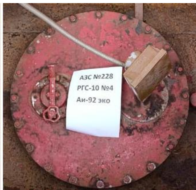
Рисунок 3 – Горловины резервуаров РГС-10 зав.№№ 3, 4