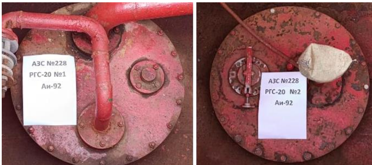
Рисунок 4 – Горловины резервуаров РГС-20 зав.№№ 1, 2