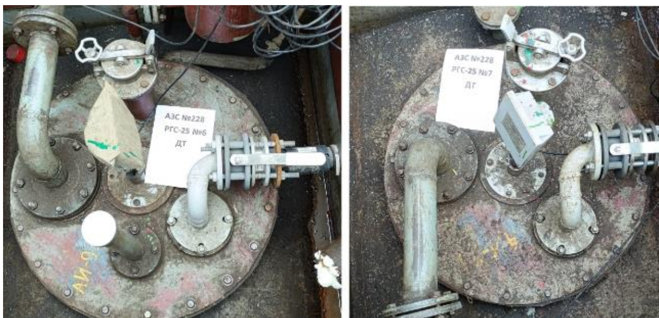
Рисунок 5 – Горловины резервуаров РГС-25 зав.№№ 6, 7

Пломбирование резервуаров РГС не предусмотрено.