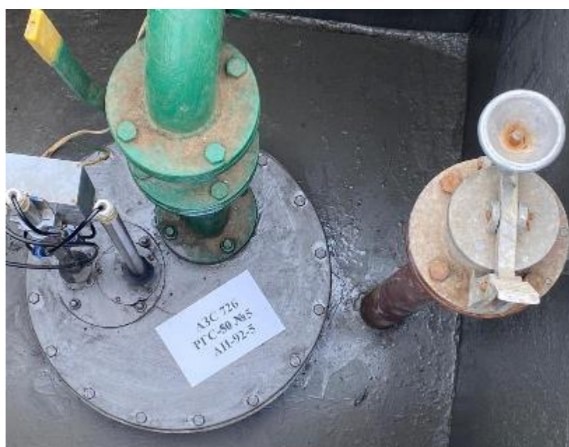
Рисунок 4 – Горловины резервуаров РГС-50 зав.№ 5

Пломбирование резервуаров РГС не предусмотрено.