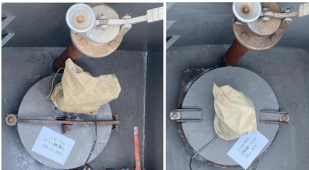
Рисунок 2 – Горловины резервуаров РГС-30 зав.№№ 1, 2