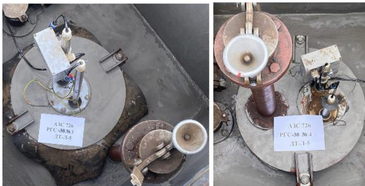
Рисунок 3 – Горловины резервуаров РГС-30 зав.№№ 3, 4