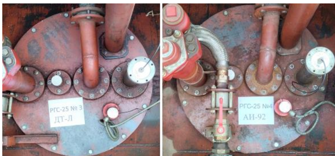
Рисунок 3 – Горловины резервуаров РГС-25 зав.№№ 3, 4