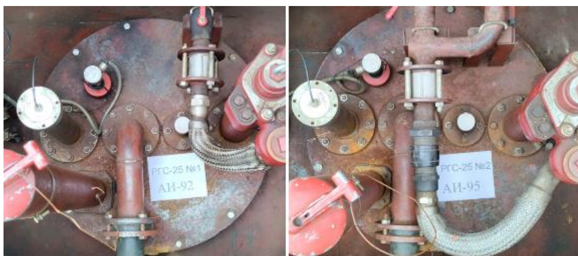
Рисунок 2 – Горловины резервуаров РГС-25 зав.№№ 1, 2