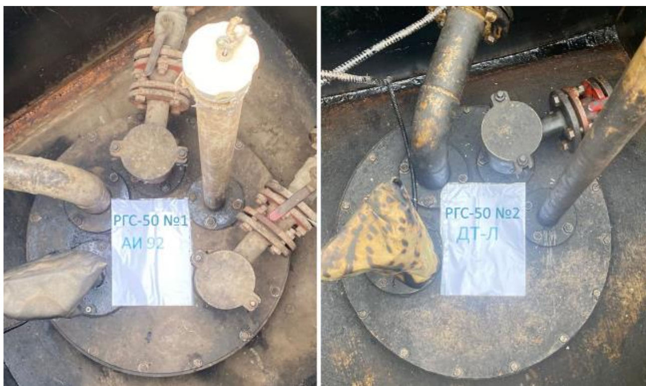
Рисунок 2 – Горловины резервуаров РГС-50 зав.№№ 1, 2