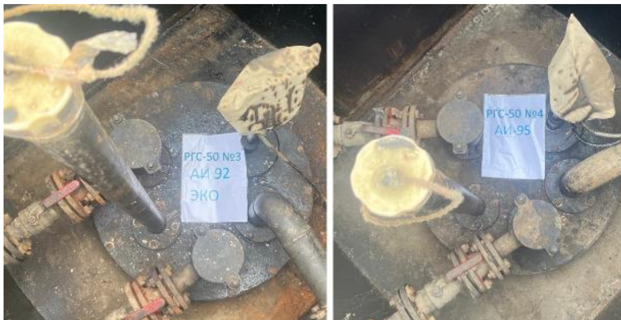
Рисунок 3 – Горловины резервуаров РГС-50 зав.№№ 3, 4

Пломбирование резервуаров РГС-50 не предусмотрено.