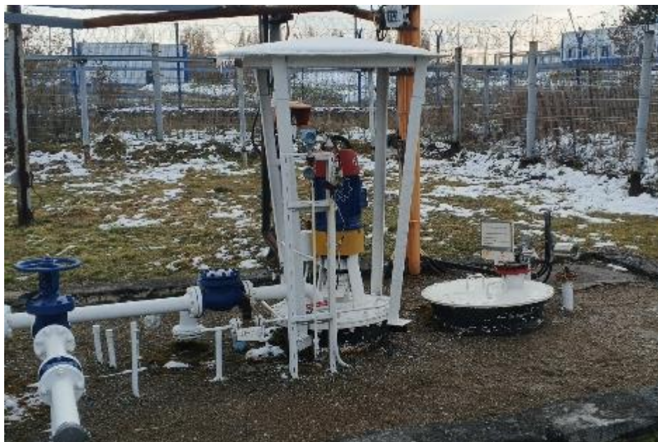
Рисунок 1 – Резервуар на месте эксплуатации