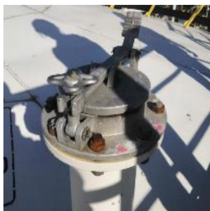
Рисунок 2 – Фотография горловины замерного люка резервуара вертикального стального цилиндрического РВС-20000 заводской № 32