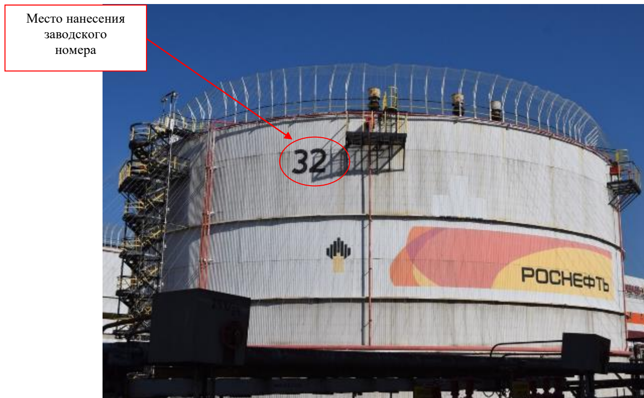
Рисунок 1 – Фотография общего вида резервуара вертикального стального цилиндрического РВС-20000 заводской № 32

Фотография горловины замерного люка резервуара РВС-20000 заводской № 38, представлена на рисунке 2.