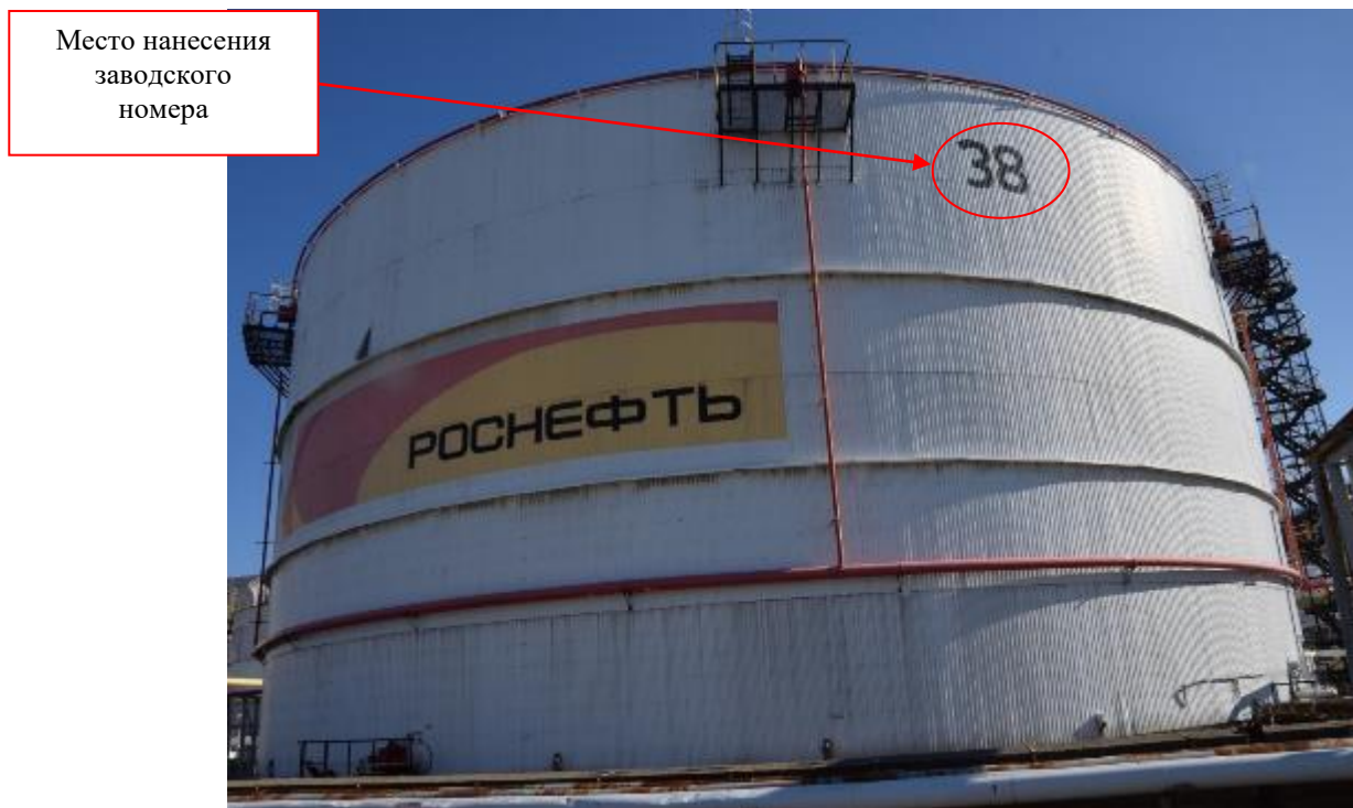
Рисунок 3 – Фотография общего вида резервуара вертикального стального цилиндрического РВС-20000 заводской № 38

Фотография горловины замерного люка резервуара РВС-20000 заводской № 38, представлена на рисунке 4.