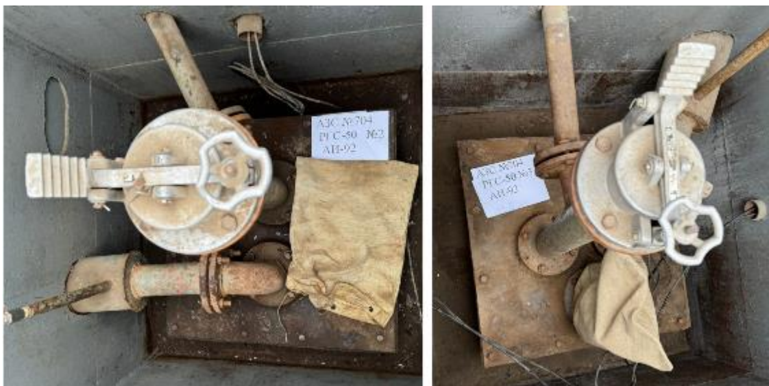
Рисунок 4 – Горловины резервуаров РГС-50 зав.№№ 2, 3