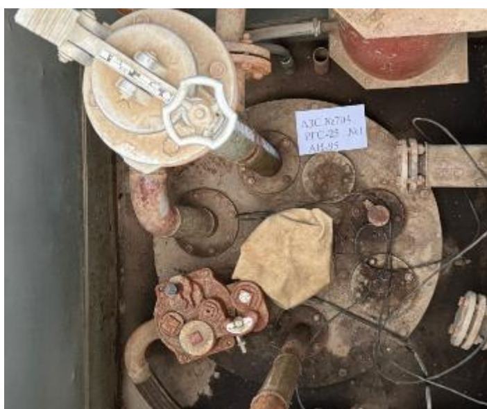
Рисунок 3 – Горловина резервуара РГС-25 зав.№ 1