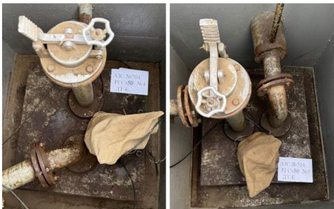
Рисунок 5 – Горловины резервуаров РГС-50 зав.№№ 4, 5

Пломбирование резервуаров РГС не предусмотрено.