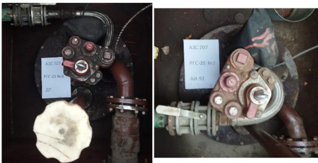
Рисунок 3 – Горловины резервуаров РГС-25 зав.№№ 1, 2

Пломбирование резервуаров РГС-25 не предусмотрено.