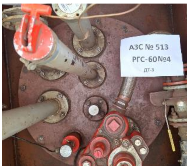
Рисунок 3 – Горловина резервуара РГС-60 зав.№ 4

Пломбирование резервуаров РГС не предусмотрено.