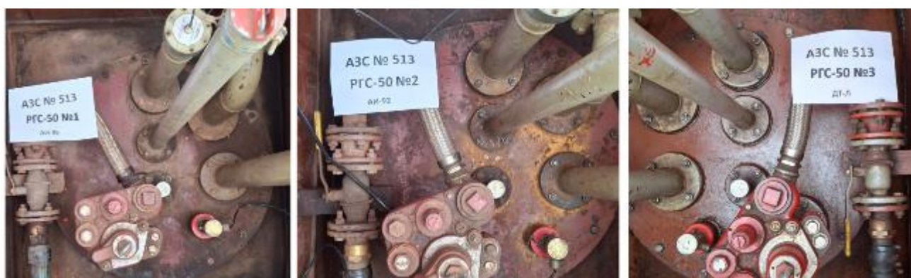
Рисунок 2 – Горловины резервуаров РГС-50 зав.№№ 1, 2, 3