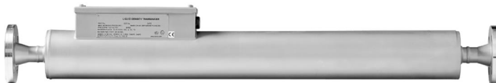
Рисунок 1 – Общий вид преобразователя плотности

Общий вид преобразователя плотности приведен на рисунке 1.