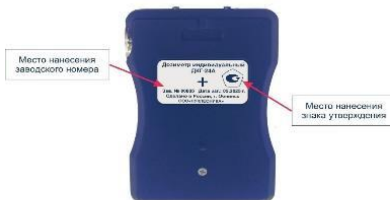
Рисунок 2 – Место нанесения знака утверждения и заводского номера на ДКГ-24А