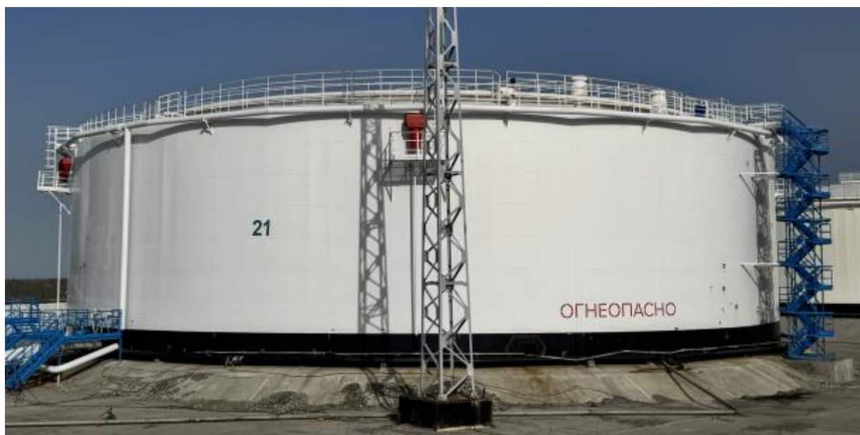
Рисунок 2 – Общий вид резервуара РВС-20000 № 21

Пломбирование резервуаров РВС-20000 не предусмотрено.