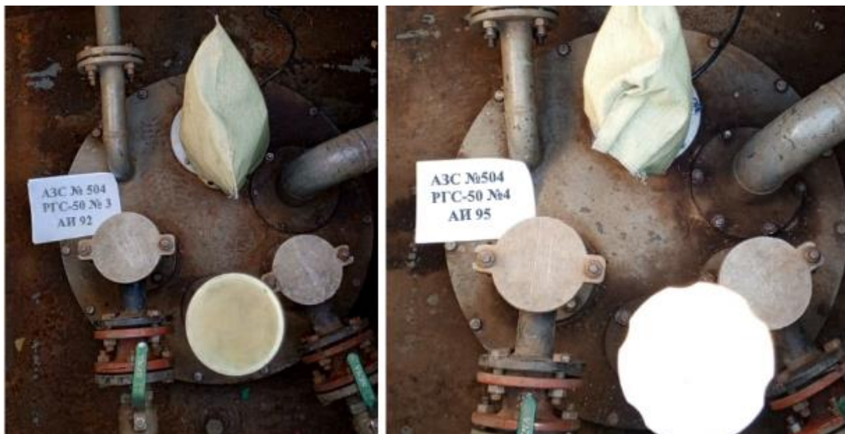
Рисунок 3 – Горловины резервуаров РГС-50 зав.№№ 3, 4

Пломбирование резервуаров РГС-50 не предусмотрено.