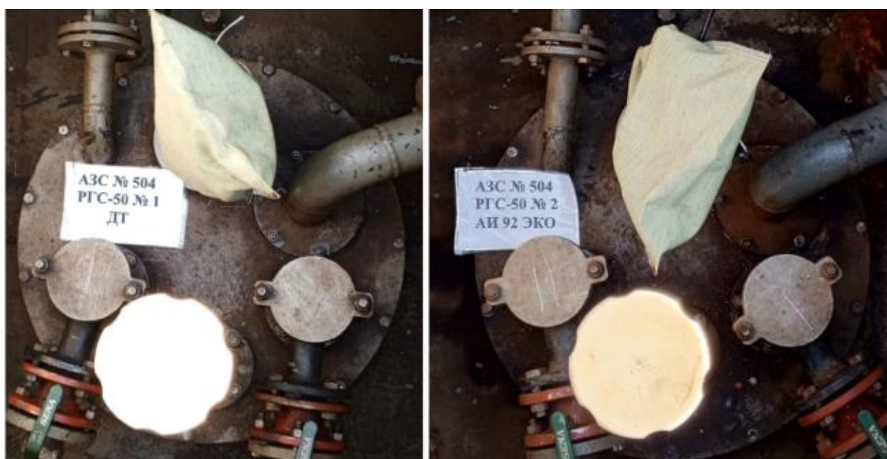
Рисунок 2 – Горловины резервуаров РГС-50 зав.№№ 1, 2