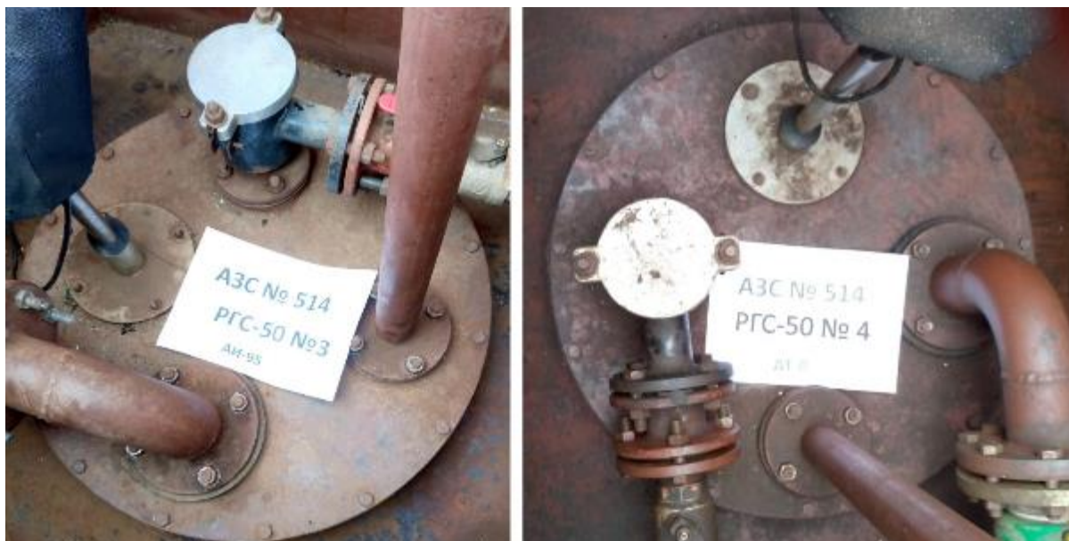
Рисунок 3 – Горловины резервуаров РГС-50 зав.№№ 3, 4

Пломбирование резервуаров РГС-50 не предусмотрено.