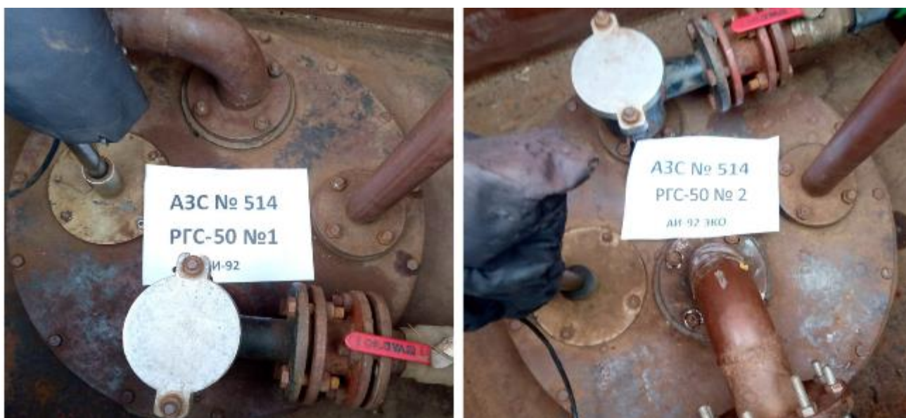
Рисунок 2 – Горловины резервуаров РГС-50 зав.№№ 1, 2