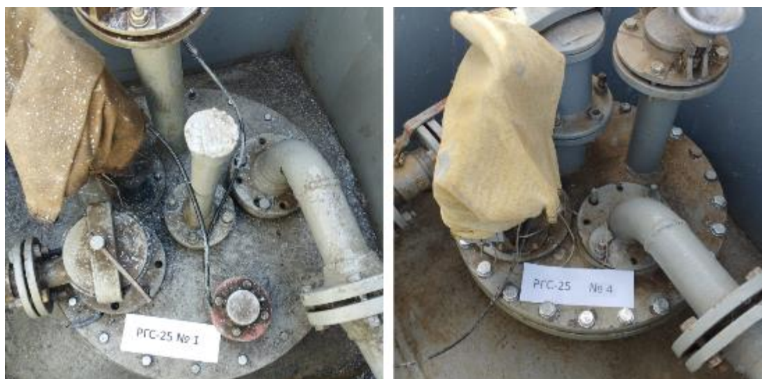
Рисунок 3 – Горловины резервуаров РГС-25 зав.№№ 1, 4