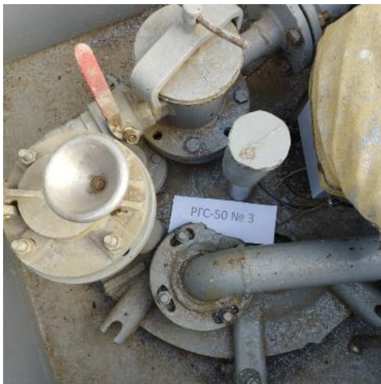
Рисунок 4 – Горловина резервуара РГС-50 зав.№ 3

Пломбирование резервуаров РГС не предусмотрено.