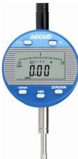
Рисунок 15 – Общий вид индикаторов модификации 211