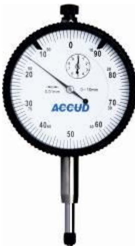
Рисунок 12 – Общий вид индикаторов модификации 291