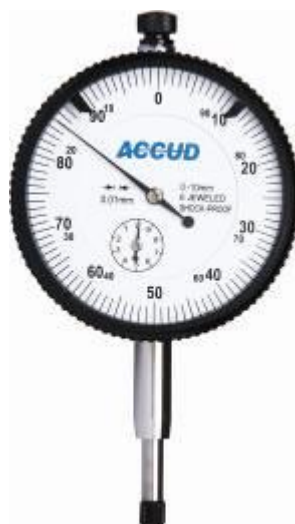
Рисунок 5 – Общий вид индикаторов модификации 226