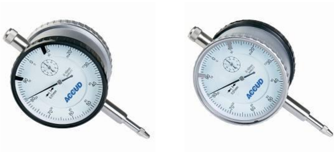
Рисунок 11 – Общий вид индикаторов модификации 233