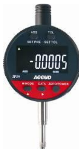
Рисунок 21 – Общий вид индикаторов модификации 217