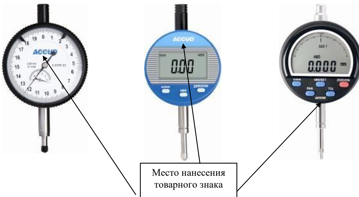
Рисунок 24 – Место нанесения товарного знака