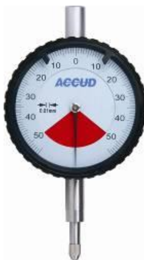
Рисунок 10 – Общий вид индикаторов модификации 232