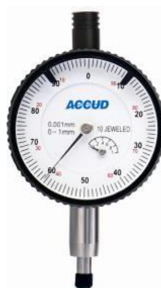
Рисунок 6 – Общий вид индикаторов модификации 228