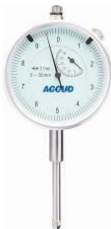
Рисунок 8 – Общий вид индикаторов модификации 230