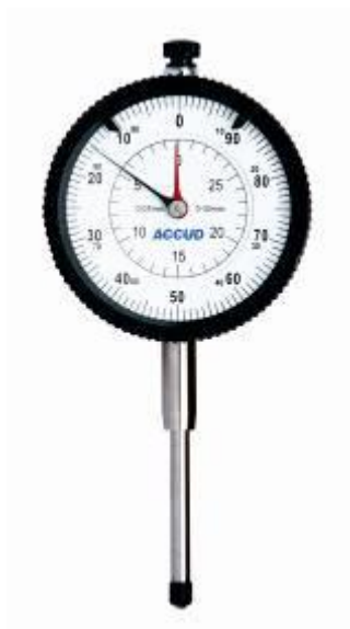
Рисунок 13 – Общий вид индикаторов модификации 292