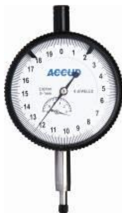
Рисунок 1 – Общий вид индикаторов модификации 221

Пломбирование индикаторов от несанкционированного доступа не предусмотрено.