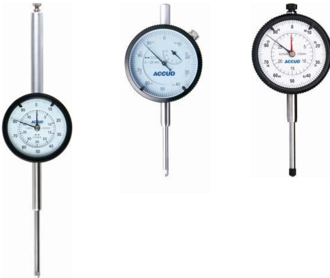
Рисунок 7 – Общий вид индикаторов модификации 229