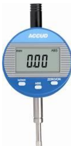
Рисунок 16 – Общий вид индикаторов модификации 212