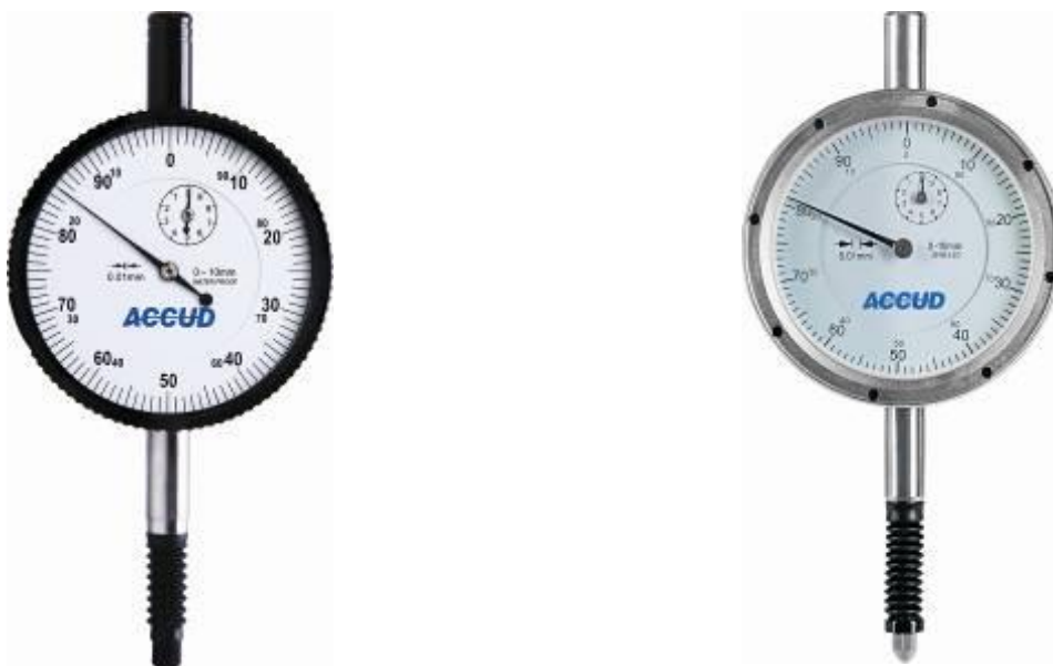
Рисунок 9 – Общий вид индикаторов модификации 231