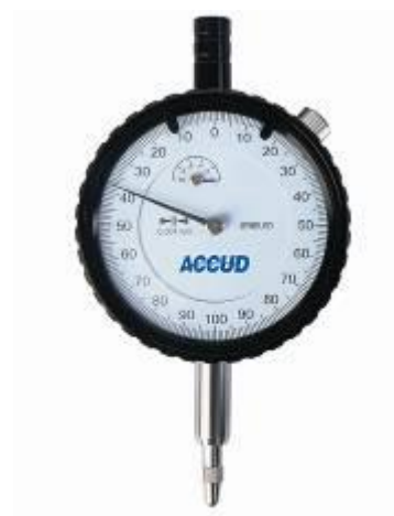
Рисунок 2 – Общий вид индикаторов модификации 222