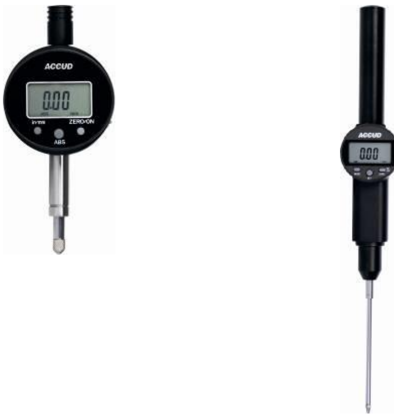
Рисунок 18 – Общий вид индикаторов модификации 214