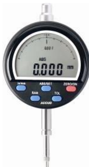
Рисунок 20 – Общий вид индикаторов модификации 216