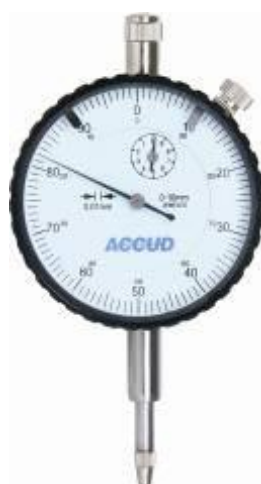
Рисунок 4 – Общий вид индикаторов модификации 224