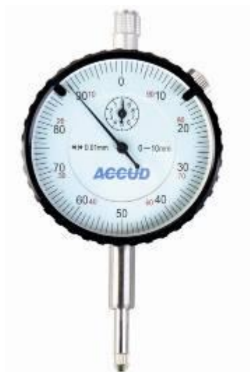
Рисунок 3 – Общий вид индикаторов модификации 223