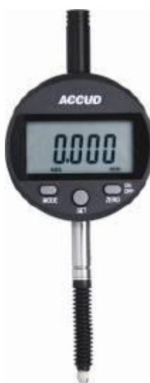
Рисунок 17 – Общий вид индикаторов модификации 213