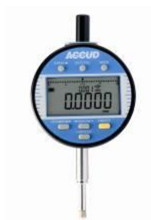
Рисунок 22 – Общий вид индикаторов модификации 218