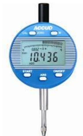
Рисунок 19 – Общий вид индикаторов модификации 215