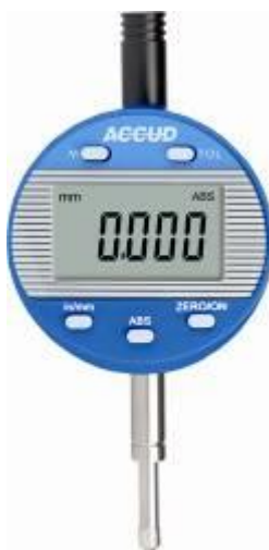
Рисунок 14 – Общий вид индикаторов модификации 210