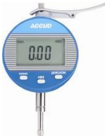
Рисунок 23 – Общий вид индикаторов модификации 227